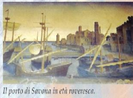
Il porto di Savona in età roveresca.