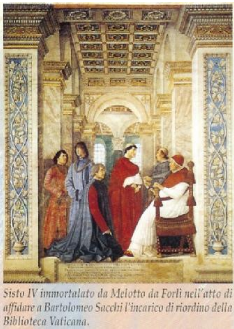
Sisto IV immortalato da Melotto da Forlì nell'atto di affidare a Bartolomeo Sacchi l'incarico di riordino della Biblioteca Vaticana.