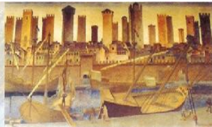
L'affresco di Savona, città delle cento torri (Palazzo Comunale).

Con le trasformazioni avvenute in quest'ultimo periodo, gli abitanti della provincia di Savona godono, in media, redditi abbastanza elevati. Questi dati statistici celano però una realtà economica e sociale molto diversa fra il litorale e l'interno: le fiorenti iniziative turistiche della Riviera, con la crescita di agenzie immobiliari e sportelli bancari, fanno da contrasto alla decadenza e all'abbandono di vaste zone del bellissimo entroterra. Il loro recupero al turismo, che attualmente con la chiusura di molte fabbriche, resta ancora il settore che produce occupazione, ( un bene ambientale che non de localizza e non immagazzina l'invenduto ). Questa è la sfida che devono affrontare, non solo le amministrazioni locali della nostra provincia, ma l'intero comparto turistico regionale.